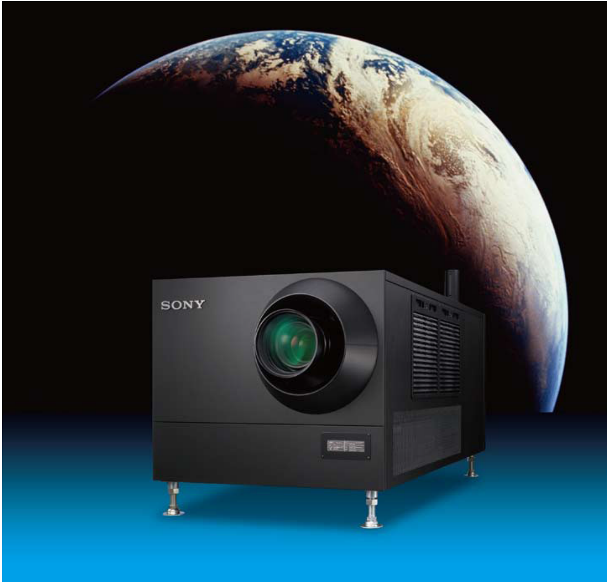
SRX-R320 4K Digital Cinema Projector